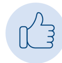
Empowerment and recognition