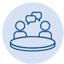
Engagement and communications